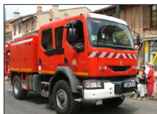
1 camion citerne rural