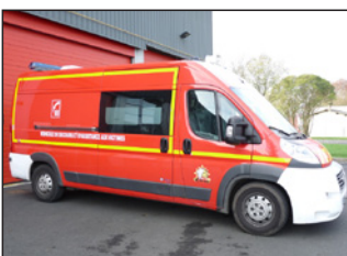
1 véhicule de secours et d'assistance aux victimes