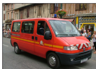
1 véhicule de transport de personnel