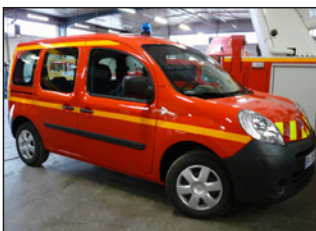
1 véhicule léger